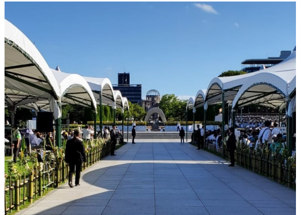
横浜市の国際平和施策について Yokohama's peace initiatives (Japanese)

核兵器のない平和な世界の実現に向けて、私たちは何ができるのか。まずは知り、考えることから始めませんか。